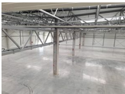
Wnętrze hali produkcyjnej