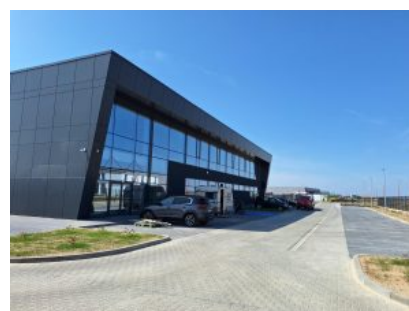
Hala produkcyjna – widok z zewnątrz na część biurową