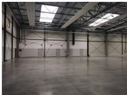
Hała produkcyjna Agencji Rozwoju Przemysłu