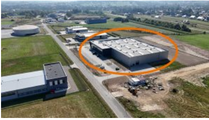
Hała Agencji Rozwoju Przemysłu