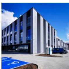
Inkubator Przedsiębiorczości Krosno