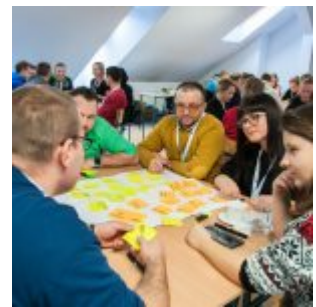
Projektanci Innowacji PFR