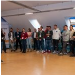
Projektanci Innowacji PFR