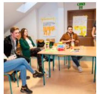
Projektanci Innowacji PFR