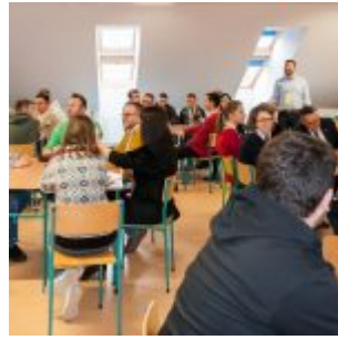
Projektanci Innowacji PFR