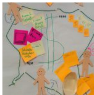
Projektanci Innowacji PFR