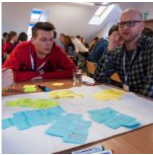
Projektanci Innowacji PFR