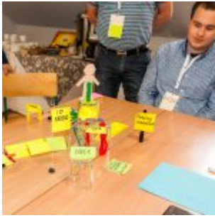
Projektanci Innowacji PFR