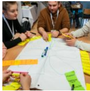
Projektanci Innowacji PFR