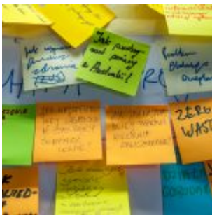
Projektanci Innowacji PFR