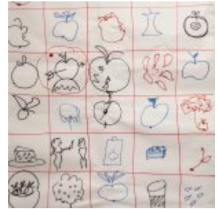
Projektanci Innowacji PFR