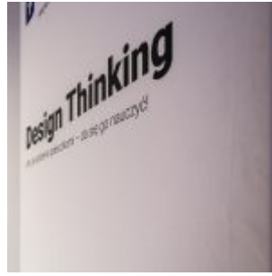
Projektanci Innowacji PFR