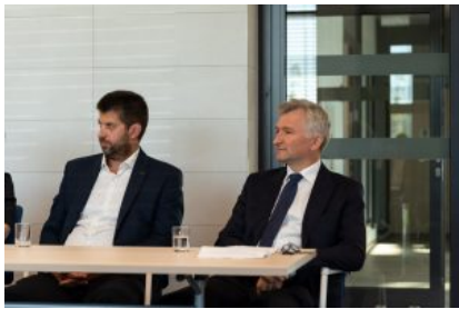
Krośnieńska Rada Biznesu