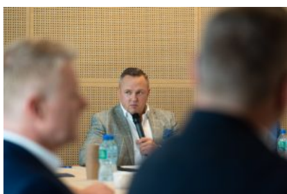
Krośnieńska Rada Biznesu