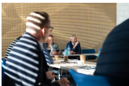
Krośnieńska Rada Biznesu – II sesja