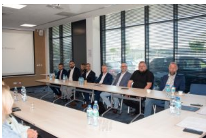
Krośnieńska Rada Biznesu – II sesja