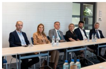
Krośnieńska Rada Biznesu- II sesja