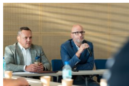
Krośnieńska Rada Biznesu – II sesja