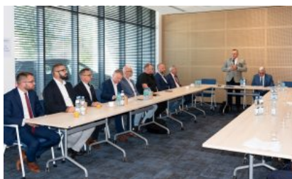
Krośnieńska Rada Biznesu – II sesja