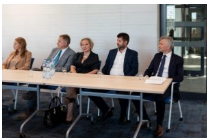
Krośnieńska Rada Biznesu