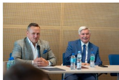
Krośnieńska Rada Biznesu – II sesja