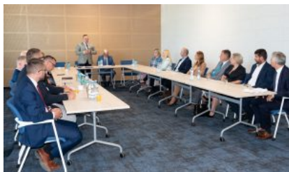
Krośnieńska Rada Biznesu – II sesja

Odmieniamy= KROSN0". Projekt uzyskał finansowanie z Funduszy Norweskich oraz budżetu państwa.