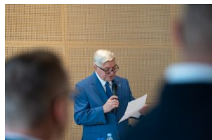
Krośnieńska Rada Biznesu