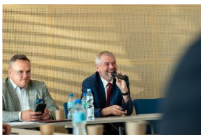
Krośnieńska Rada Biznesu