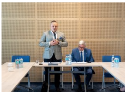
Krośnieńska Rada Biznesu – II sesja