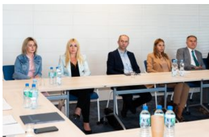
Krośnieńska Rada Biznesu