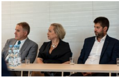
Krośnieńska Rada Biznesu