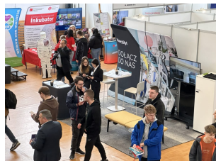
XI Targi Pracy PANS