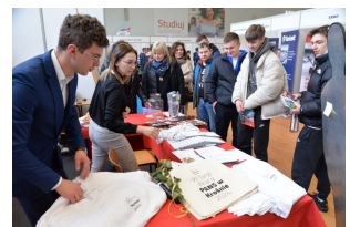
XI Targi Pracy PANS